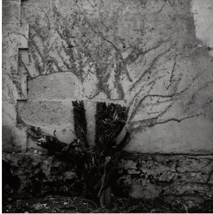
Fouras, "wild grapevine"